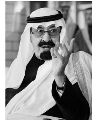
Kungen av Saudiarabien får köpa vapen av Sverige

Vapenexporten till ickedemokratier har ökat med 373% under perioden 2006-2010 i jämförelse med perioden 2001-2005. Exporten till ickedemokratier under de fem första åren, med socialdemokratisk regering, var sammanlagt 2,2 miljarder, en summa som ökat till 10,7 miljarder under alliansens fem följande år. Den absolut största ökningen står Pakistan för. Men även till länder som Förenade arabemiraten, Saudiarabien, Thailand och Brunei har det skett en stor ökning. Ser man bara till diktaturer är förändringen ännu större, från 400 mnkr till 3,5 mdkr.